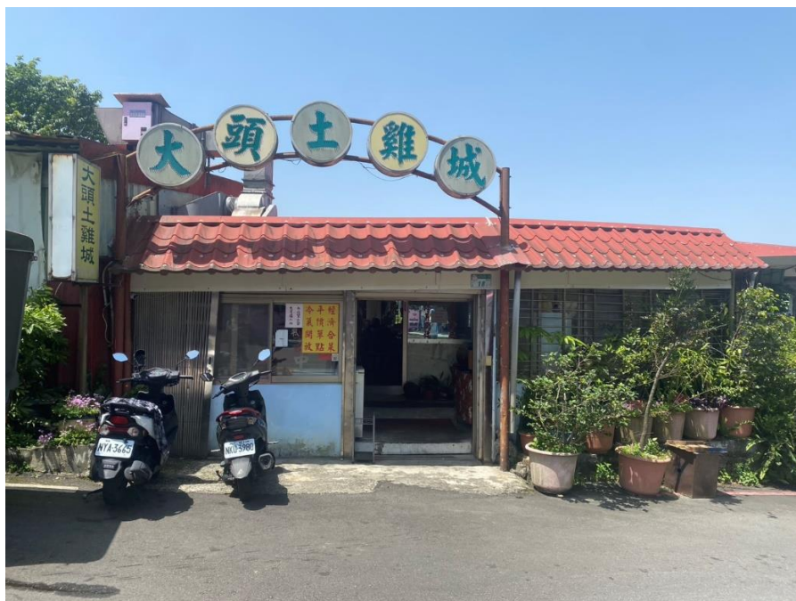
中午用餐地點: 貓空纜車站斜對面