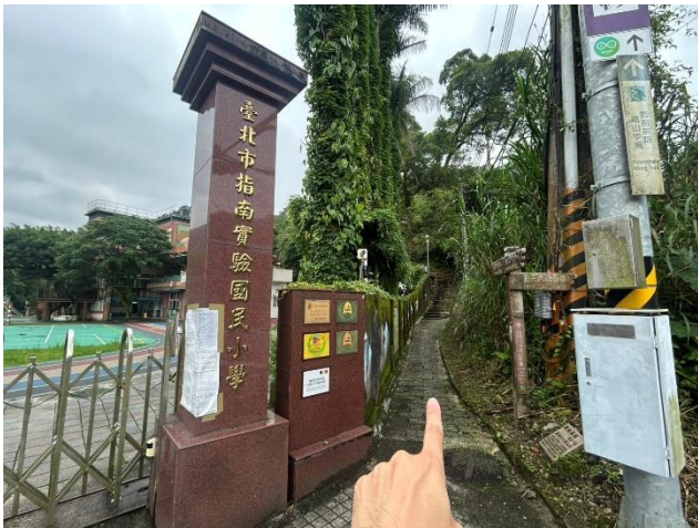
指南國小旁三玄宮步道