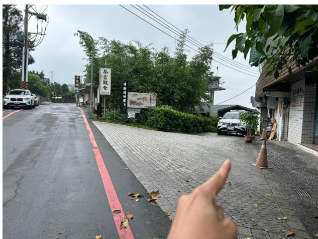
樟樹樟湖步道入口