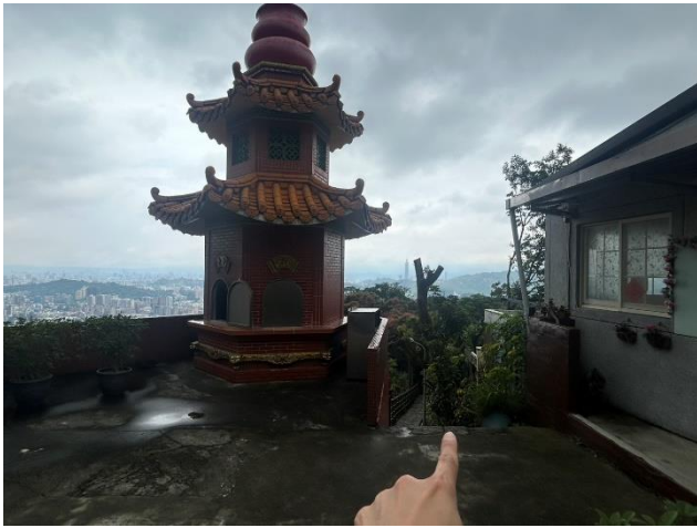
樟山寺旁往指南國小步道