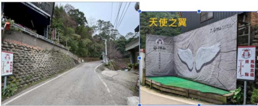
情人谷、終點-南坪古道口