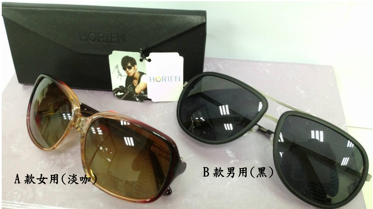
紀念品(羅志祥代言偏光高級太陽眼鏡)

※ 會員憑 103 年度會員證辦理報到領回保證金，並領取路線圖、礦泉水、禮券 300 元及紀念品(羅志祥代言偏光高級太陽眼鏡，市價約 4000 元)兌換券。禮券及紀念品於餐廳發放，僅限會員本人，眷屬不提供。